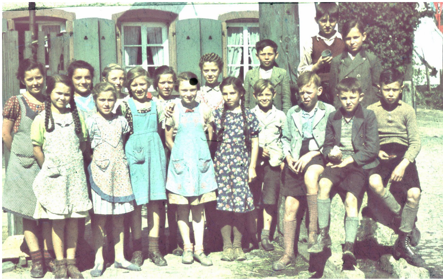
7. Schulklasse 1940