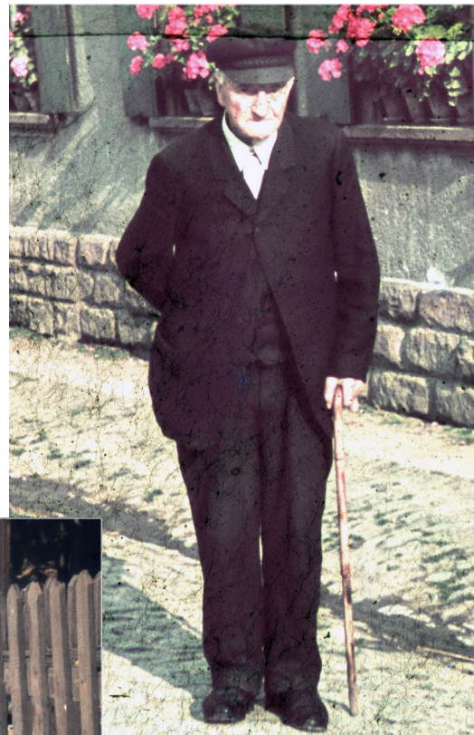
Heinrich Traxel 1939