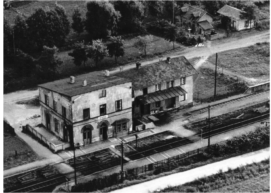
Bahnhof Dreihof 1944