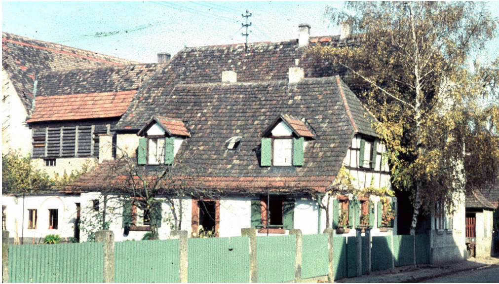
Anwesen Bohl 1957