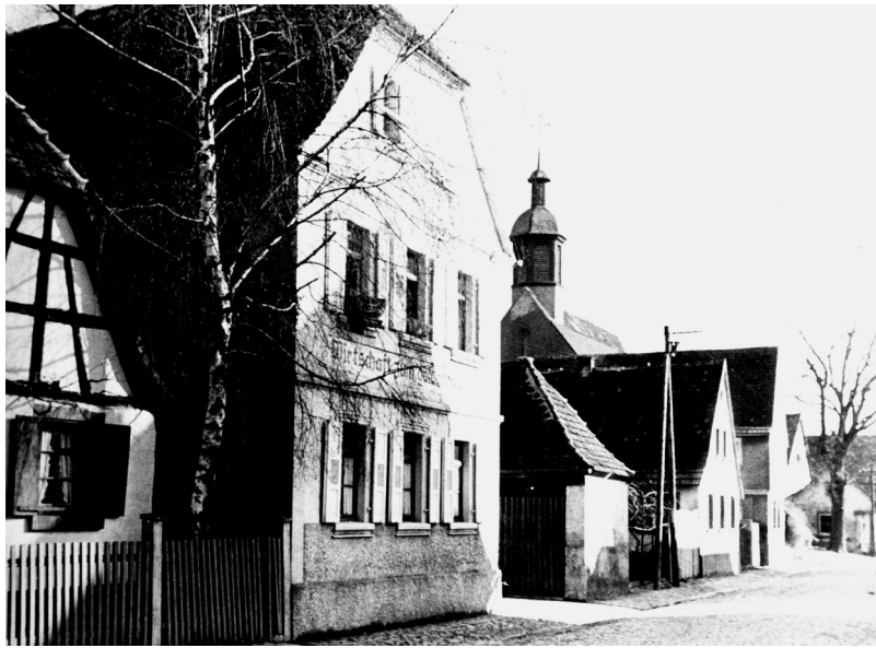
Gasthaus Goldener Adler 1952