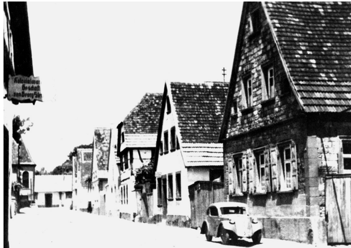
Hauptstraße 1950, Auto: Gutbrod Superior